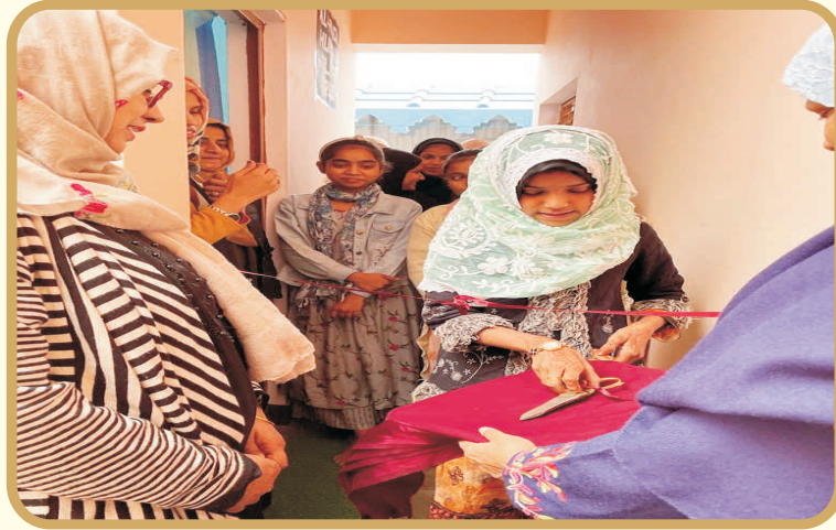
Inauguration of Learn & Earn Centre