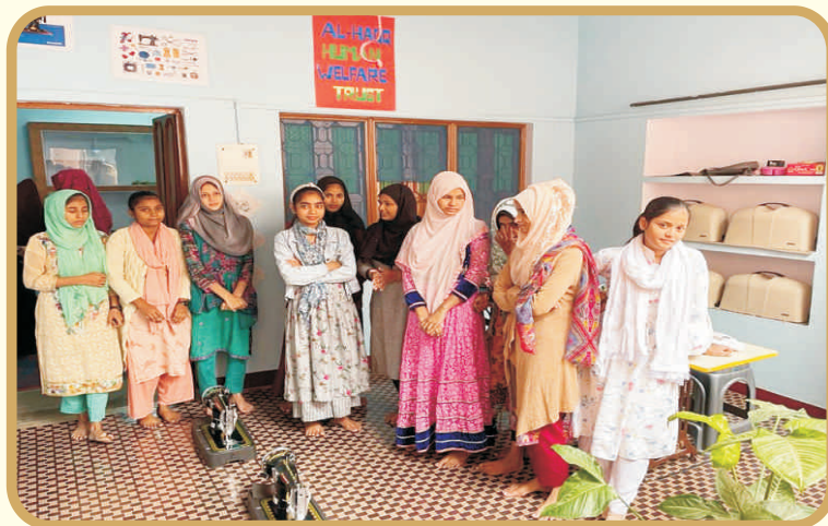
Learners at the Centre