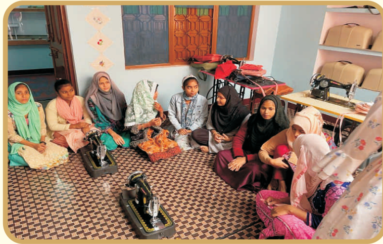
Learners at the Centre