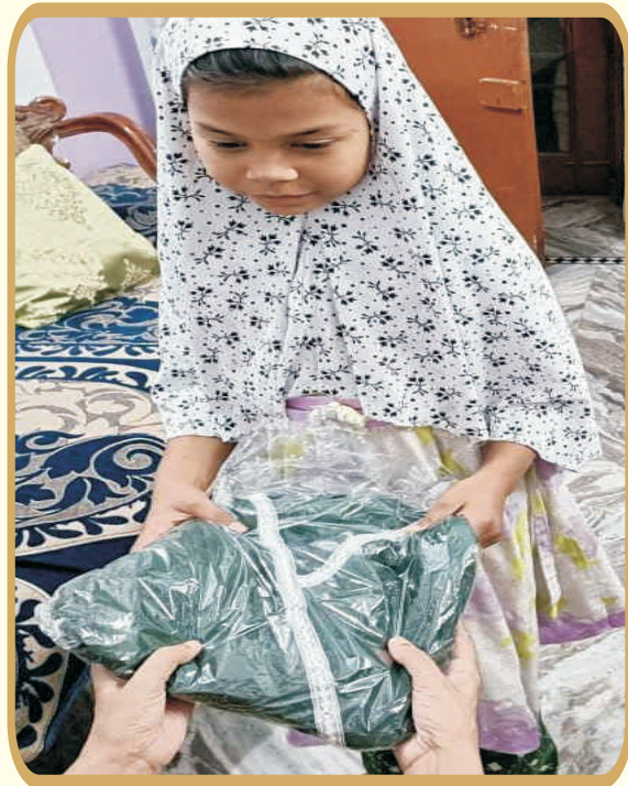
Clothes Distribution on Eid-ul-Fitr by the Trust