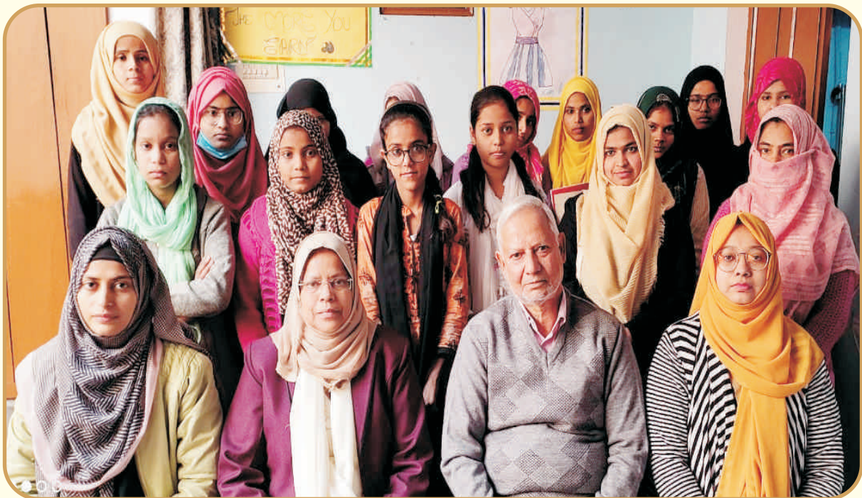
A group of learners alongwith the President, Secretary & Incharges